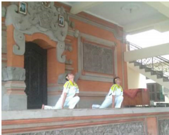
Gambar 2. Gerakan Asvasancalanasana

Lutut kiri ditekuk sambil menarik kaki kanan sejauh mungkin kebelakang, jempol kaki dan lutut diusahakan menyentuh lantai.Pastikan telapak kaki kiri sejajar dengan kedua telapak tangan. Panggul dicondongkan ke depan tulang belakang dilengkungkan sambil tengadah sambil menarik nafas. Konsentrasi dipusatkan pada dahi diantara kedua alis mata. Peregangan akan terasa dari paha ke bagian atas tubuh sampai pada diantara kedua alis, kemudian ucapkan doa; “Om bhanave namah” yang berarti penghormatan pada yang menyinari, agar kegelapan yang ada dalam diri berakhir. Manfaatnya : Memijat organ perut dan memperbaiki fungsinya, memperkuat otot-otot kaki, menyeimbangkan urat saraf.